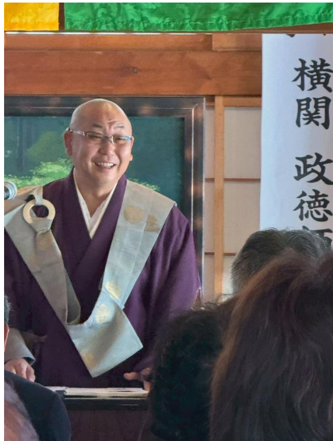
横関師の慈愛溢れる笑顔